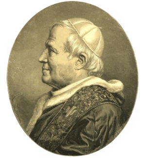
bł. Pius IX Konstytucja Apostolska Ineffabilis Deus