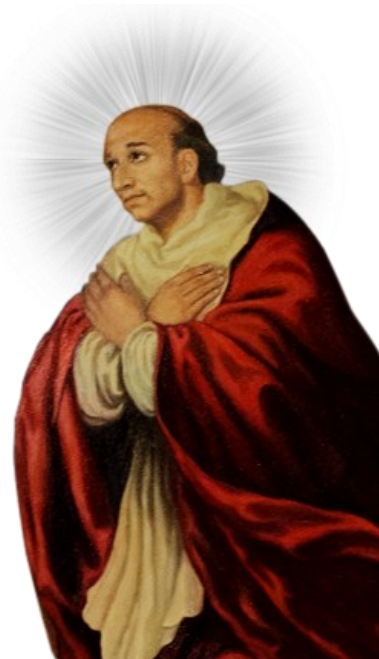
św. Karol Boromeusz

Gdyby mnie zapytał człowiek świecki: co mam czynić, żeby duszę swoją ratować, nie mógłbym zaiste podać mu lepszego i pewniejszego sposobu, jak wstąpienie do Sodalicii Mariańskiej. Oto środek, który obejmuje wszystkie inne, służąc do zbawienia duszy, chociażby były najpewniejsze.