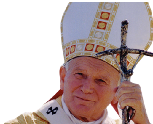
św. Jan Paweł II, RMs 92

U progu trzeciego tysiąclecia cały Kościół wezwany jest do głębszego przeżywania tajemnicy Chrystusa i pełnej wdzięczności współpracy z dziełem zbawienia. Czyni to z Maryją i tak jak Maryja, która jest dla niego Matką i wzorem: jest Ona wzorem macierzyńskiej miłości, jaka powinna ożywiać wszystkich tych, którzy w dziele misyjnego apostołstwa Kościoła współpracują nad odrodzeniem człowieka. Dlatego też „Kościół wzmocniony obecnością Chrystusa (...) pielgrzymuje w czasie do końca wieków, idąc na spotkanie Pana, który przychodzi, ale na tej drodze (...) kroczy śladami wędrowni odbytej przez Maryję Dziewicę”