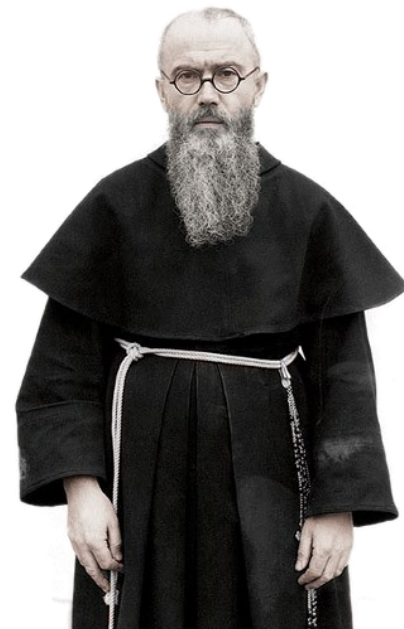
Św. Maksymilian Maria Kolbe

Oddajemy Jej całą Istotę swoją, wszystkie władze duszy, a więc i rozum i pamięć i wolę; wszystkie władze ciała, więc zmysły wszystkie i każdy w szczególności i siły, zdrowie czy chorobę, oddajemy Jej całe swoje życie ze wszystkimi jego przejściami czy przyjemnościami, czy przykrymi, czy obojętnymi. Oddajemy Jej naszą śmierć, kiedykolwiek i gdziekolwiek i w jakikolwiek: sposób ona nas spotka. A nawet i wieczność całą. Owszem spodziewamy się, że tam dopiero bez porównania doskonalej do Niej należeć będziemy mogli. W ten sposób wyrażamy pragnienie i błaganie, by nam dozwoliła coraz doskonalej pod każdym względem stawać się Jej. To poświęcenie się nie wymaga bynajmniej, by zaraz opuścić świat, rodzinę i wstąpić do klasztoru. Nie. Można w dalszym ciągu w dotychczasowym stanie oddawać się wszystkim dotychczasowym uczciwym zajęciom, tylko że to już nie my sami ofiarujemy te nasze codzienne zajęcia Bogu, ale Ona: Niepokalana, Której staliśmy się własnością, je ofiaruje. I to ofiaruje je nie jako nasze, ułomne, pełne niedoskonałości, ale jako Swoje własne, bo my ze wszystkim, co nasze jest, do Niej należymy.