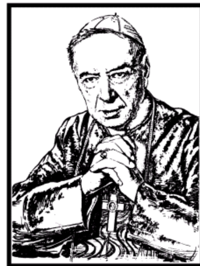
Stefan kardynał Wyszyński.